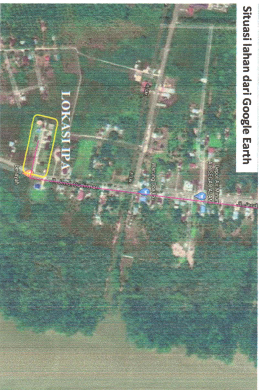
Situasi lahan