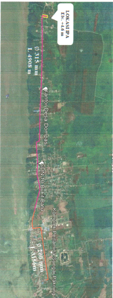
jalur pipa distribusi utama di Kec. Sei Pakning