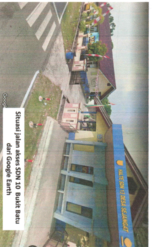
Situasi jalan akses SDN 10 Bukit Batu dari Google Earth