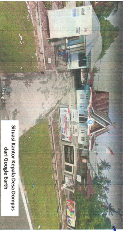
Situasi Kantor Kepala Desa Dompass dari Google Earth